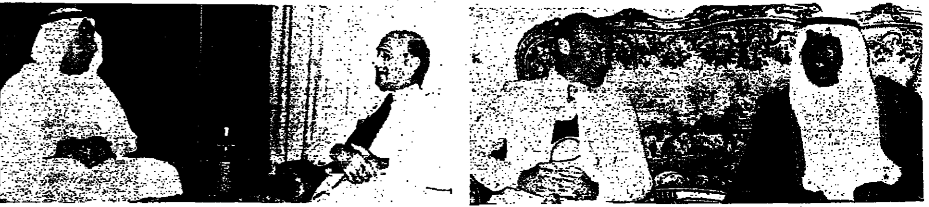
الوزير بطرس اثناء اجتماعه مع السيد سعد المداخله والداخله الكوسى... ومع السيد جابر العلي نائب رئيس الحكومة ووزر الاعلام الكوسى